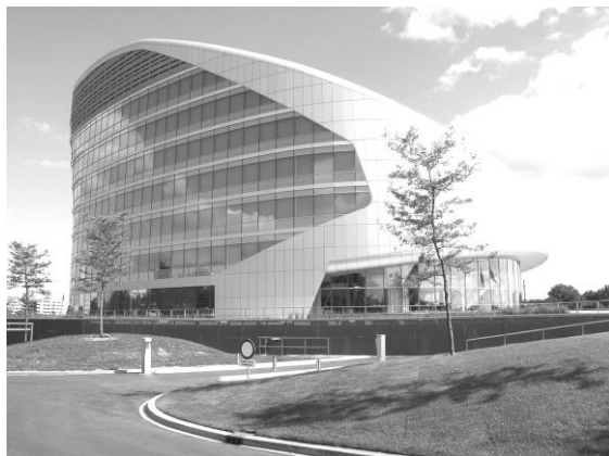
Europees hoofdkantoor SABIC

In mijn boekenkast heb ik twee al twintig jaar oude boekjes staan, getiteld “Lelijk gebouwd Nederland” en “Mooi gebouwd Nederland”. Geregeld ga ik de postbus legen en dan zie ik op het Bedrijventerrein (inmiddels BedrijvenStad) Fortuna ontwikkelingen die mij onwillekeurig tot de parafrazering “Mooi en Lelijk gebouwd Sittard” hebben gebracht. De realisatie van een paar architectonisch in het oog springende projecten werd daar namelijk teniet gedaan door op een zichtlocatie bij de entree van het gebied de “loods” van Carglass toe te staan.